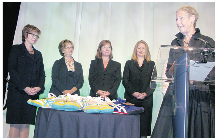
格林(右一)演講得到包括前財政廳長泰萊(後排左1)等政商界名人的支持。