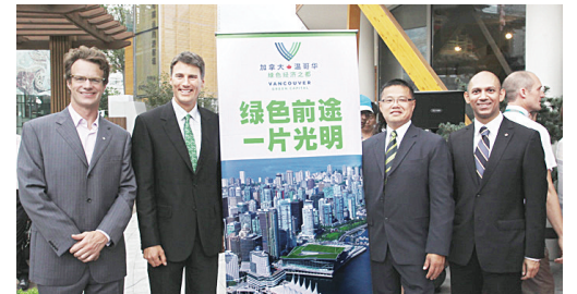
溫哥華市長羅品信(左2)及溫哥華市議員雷健華(右2)出席了「溫哥華綠色經濟日」活動。

至於在昨日下午迎來第50萬名旅客的慶祝儀式,羅品信說,目前每年自中國到溫哥華的旅客人數達到10萬人,光是在2010年即將增長10%,今年加中兩國簽署指定旅遊目的地國家(ADS)協議後,預計將帶來更大量