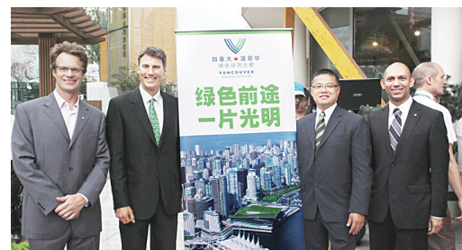
溫哥華市長羅品信(左2)及溫哥華市議員雷健華(右2)出席了「溫哥華綠色經濟日」活動。

至於在昨日下午迎來第50萬名旅客的慶祝儀式,羅品信說,目前每年自中國到溫哥華的旅客人數達到10萬人,光是在2010年即將增長10%,今年加中兩國簽署指定旅遊目的地國家(ADS)協議後,預計將帶來更大量