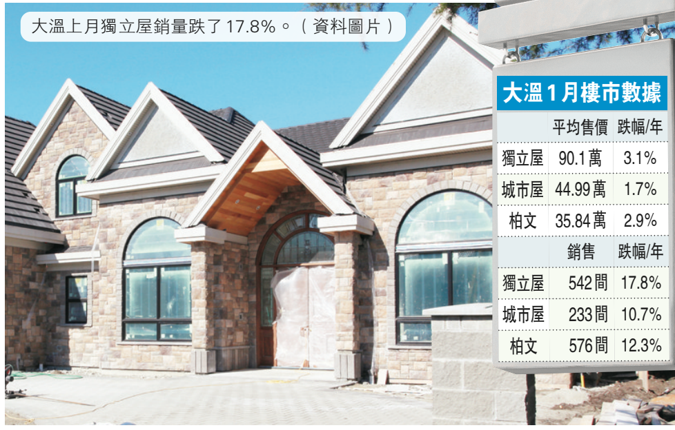
大溫上月獨立屋銷量跌了 17.8%。

與上月相比則減少 4.5%，是連續第四個月錄得跌幅。克萊恩解釋，部分賣家寧願收回放盤，也不願意降價出售房屋。 在價格方面，2013 年 1 月獨立屋平均售價為 901,000 元，較一年前下跌 3.1%，銷售數目亦由前一年的 659 間，減少 17.8% 至只有 542 間。 柏文同樣價量齊跌，1 月僅有 576 間易手，按年下跌 12.3%，平均價格則下跌 2.9% 至 358,400 元。城市屋平均價按年跌 1.7% 至 449,900 元，較去年 4 月的高位跌 7.7%。銷量則跌 10.7% 至 233 間。