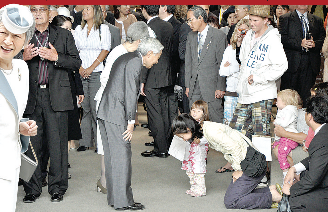
▲日皇夫婦問候日加混血小女孩，其日裔母親向日皇夫婦跪下行鞠躬禮。