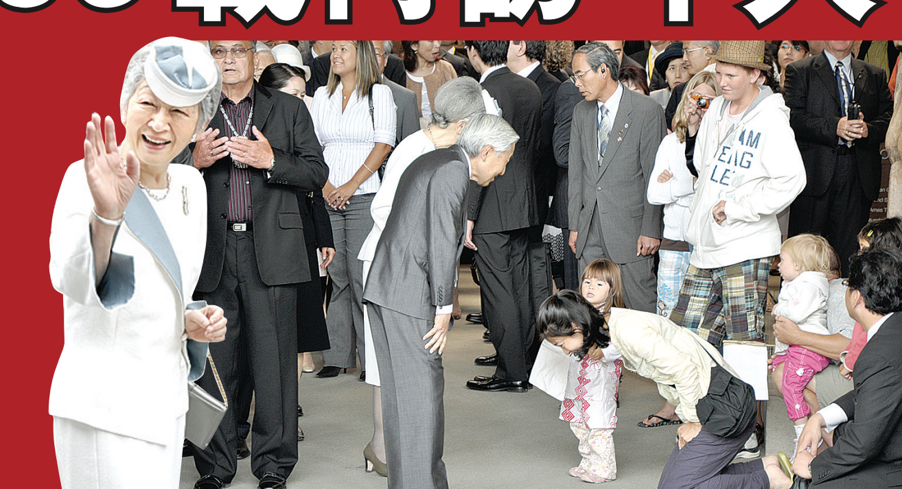
▲日皇夫婦問候日加混血小女孩，其日裔母親向日皇夫婦跪下行鞠躬禮。