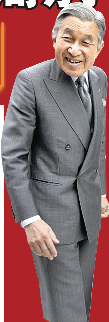
日皇夫婦在人類學博物館門口向人群揮手致意。

日皇伉儷首先參觀亞洲中心（Asian Centre），入口沿路有近百名市民等候圍觀，不少日裔人士扶老攜幼，在日皇伉儷下車向人群揮手致意時，激動地揮舞日本及加拿大國旗，並高呼「歡迎」。 繼歡迎儀式及遊覽日本花園（Nitobe Memorial Garden）後，日皇伉儷又參觀了校園內的人類學博物館（Museum of Anthropology），沿途不斷向陪同人員詢問原住民藝術品詳情。日皇夫婦亦主動親近排列在另一側的民衆，在問候一名日加混血小女孩時，其日裔母親表現激動，跪下不斷向日皇夫婦行鞠躬禮。 美智子皇后其後在觀看原住民藝術家 Vince Fairleigh 介紹其作品「月亮面罩」時，表現得非常感興趣，一直細心傾聽及閱讀注釋。 日皇伉儷離開時，在博物館門口再次向人群揮手致意。不少日裔母親抱着小孩湧上前爭相與日皇夫婦握手，在成功與日皇握手後心情激動，不斷互道「恭喜」。