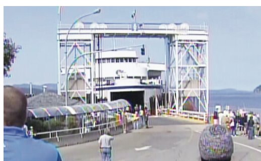
納奈莫皇后號周二撞碼頭後，預期明日重投服務。

月6日(周五)恢復服務；為應付納奈莫皇后號已預訂留位乘客，會安排Bowen Queen特別加開10時20分一班，由杜華遜(Tsawwassen)出發，前往Galiano島和Mayne島。