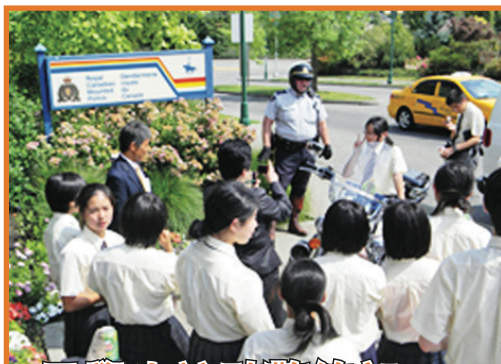
日學生訪騎警總部

來自日本江東區的一群學生，前日下午抵達結為「姐妹市」素里市的皇家騎警總部參觀。學生們與交通警察交流，並開心地撫摸警犬，更與素里警方的「騎警熊」吉祥物公仔玩得不亦樂乎。