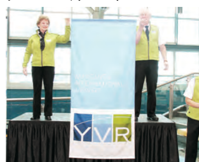
機場員工展示新的機場標誌。

伯格指出，當局將會在本月底，展開耗資 4.2 億元的機場航廈擴建工程，因此決定改一個全新的標誌，象徵溫哥華國際機場正式進入另一個階段。他強調，當局也有一個新的口號「超越每一天」，代表機場當局對