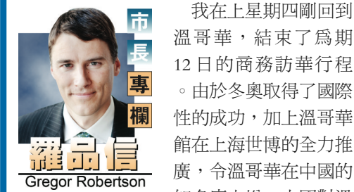
市長專欄 Gregor Robertson

我在上星期四剛回到溫哥華，結束了為期12日的商務訪華行程。由於冬奥取得了國際性的成功，加上溫哥華館在上海世博的全力推廣，令溫哥華在中國的名聲大增，中國對溫哥華的認識程度升至新高，這亦是我們乘著這股氣勢，進行了這次籌備多月的商業代表團出訪中國的原因。 我們這次訪華，有22間從事清潔技術、綠化建築及數字媒體的本地公司參與。這些行業是在溫市增長最快而正在全球各地尋找發展市場的行業。在這12天內，我們與中國政府官員及商界領袖會面，並就建立新的商機、投資及伙伴關係進行了討論。作為市長，本人有機會與中國政府官員會面並協助他們與我們的商業代表建立了溝通的橋樑。我在訪問期間曾與北京、上海、天津及廣州的政府及商界領袖見面。 我們這次出訪的目的是要協助溫市商界創造新的職位及吸引投資到本市。如能與中國方面建立新的夥伴關係，溫哥華的商界便可聘用更多員工及投資在新的技術上。我可引以為傲的是在中國短短數天內便達成了幾份合約，而更多的合約將會在未來幾個月簽署。 我們第一份合約是與Cisco Information Systems 簽訂，這間國際性資訊系統公司和溫哥華一樣，在上海世博設有展館，我們聯同溫哥華能源監控公司 Pulse Energy 簽訂的合約，讓溫哥華的樓宇（包括市政大樓）可以採用Cisco最新的技術，幫助我們節省能源開支，同時亦有助建立 Pulse Energy 的商業地位，從而進一步確立溫哥華成為創新技術及創意行業中心的國際聲譽。 我們亦與Sino-Singapore Tianjin Eco-City 簽約成立一個加拿大生態中心，推廣溫哥華以及加拿大的高水平綠化建築技術。這中心可讓加國公司打進中國的市場，尤其是對環保建築技術需求劇增的華北地區。這合約的其中一方是曾經參與設計奧運村的Vancouver Global Green公司，衆所周知，奧運村已獲頒發LEED白金級的環保評級，亦即是說這是全球最綠化的社區。 我很有信心在未來數月還會有其他與本地企業達成的合約公布，這些溫哥華的商界領袖自費加入我們的訪問團，他們的支出超過35萬元，同時投了不少時間和精神在這次訪問之中。我有信心這些工作必定會得到回報，令溫哥華得以創設更多工作職位及引進更多投資。 我對在中國獲得熱情款待有很深的感受，亦對能夠增進溫哥華與中國之間的聯繫和友誼感到十分驕傲。加拿大最近成為中國的指定旅遊目的地，我確信我們之間在文化及經濟上的聯繫將會隨著年月繼續增長。