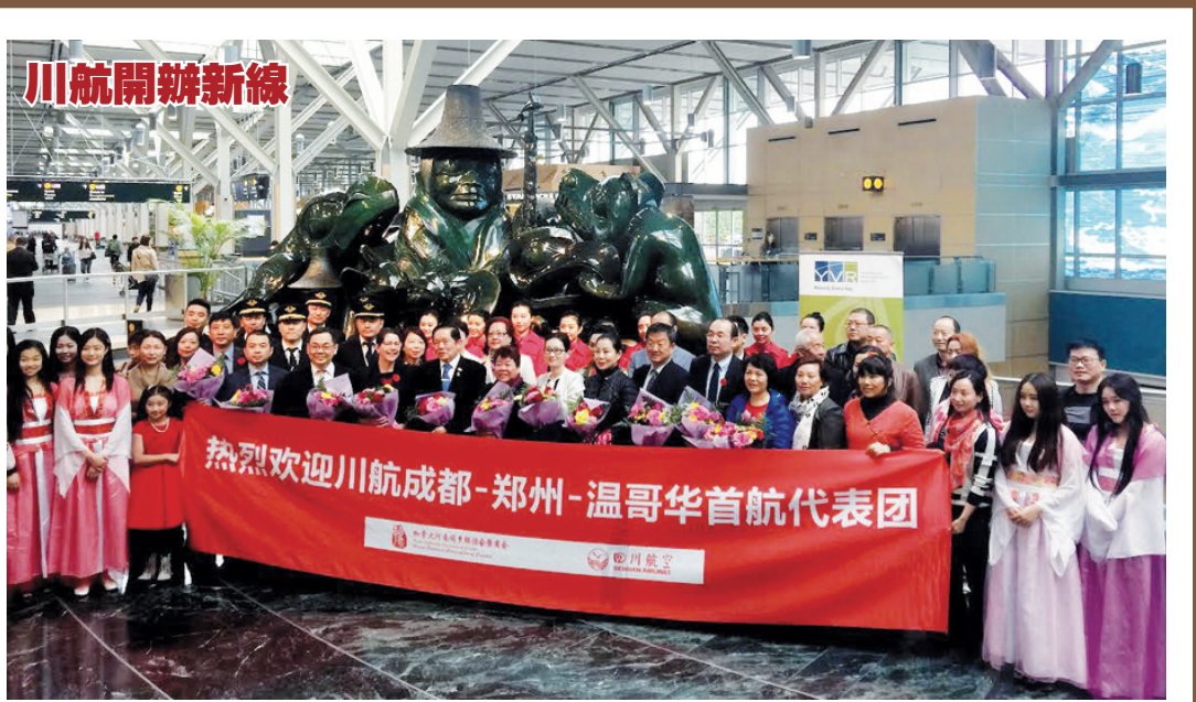
溫哥華國際機場 (YVR) 本月 11 日迎來首個從中國鄭州新鄭國際機場 (CGO) 起飛的 3U8501 航班, 這個由四川航空開辦的航線每周兩班, 抵達及離開溫哥華國際機場的時間分別是上午 8 時 35 分和上午 10 時 25 分。聯邦參議員胡子修及列治文市長區澤光等參加首航的歡迎儀式。