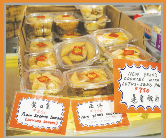
角仔、笑口棗等備受市民喜愛。