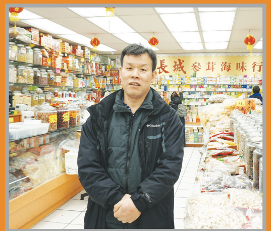
朱先生表示春節期間銷量比平時增長約三成。

華裔市民俞太太對該餐室的角仔情有獨鍾。她表示，這家的角仔特別鬆脆，口感獨特，一年只有春節期間才有出售，所以每年都很期待新年的到來。今年她還特別打電話催促老闆推出角仔，一飽口福。