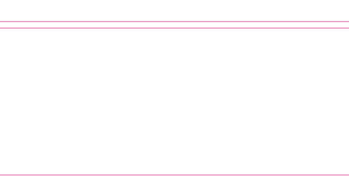
旅加北京聯誼總會日前在 Michael J. Fox Theater 舉辦了盛大的春節聯歡晚會,新老移民歡聚一堂,喜迎羊年。

旅加北京聯誼總會日前在 Michael J. Fox Theater 舉辦了盛大的春節聯歡晚會,新老移民歡聚一堂,喜迎羊年。中西表演藝術家高水準的精湛技藝受到全場觀眾的熱烈歡迎。優美的歌聲,歡快的民族舞,典雅的芭蕾舞,抒情的弦樂四重奏,嘹亮的蘇格蘭風笛等,令一眾享受了一個令