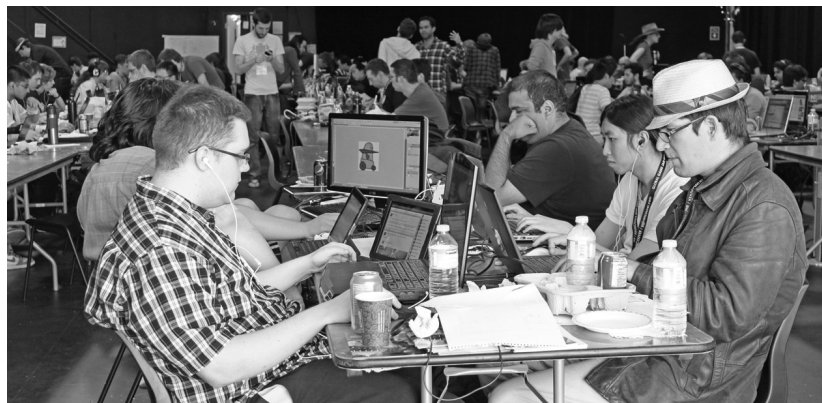
逾 150 位專家聯合開發女性作主角的視頻遊戲。

所有程式員在周五晚 6 時抵達數碼傳媒中心，並住在園區中，開始日以繼夜地趕工。除此之外，世界各地另有數百人通過遠程連接的方式參與這款遊戲的開發，昨日現場就有巴西、英國、澳洲等地的程式員通過視頻共同討論。這一視頻遊戲將在今日下午 4 時完成，於 4 時 30 分公布並展示。