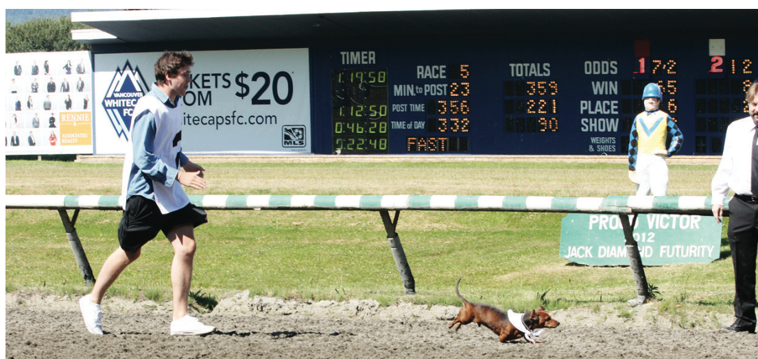
狗主落場驅趕愛犬衝向終點。