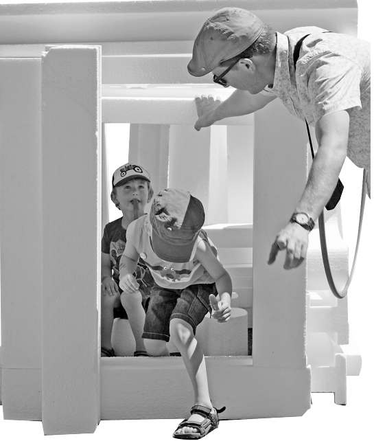
市民現場拼搭出各種景觀建築模型。