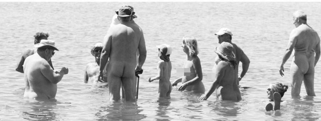
昨日在新月岩沙灘的集體裸泳是全北美洲活動的其中一個環節。

【明報專訊】十多人昨日在素里的天體沙灘裸體下海，參加全北美同一時間的集體裸泳活動。主辦機構的會長特別向華裔社群作出呼籲，歡迎華人參加天體活動。