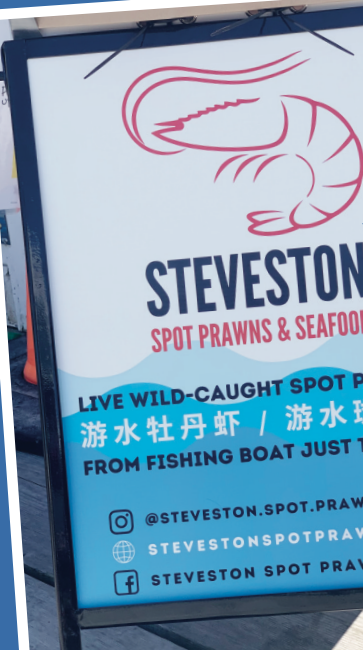
▲史蒂夫頓碼頭上周末開始提供新鮮斑點蝦。

【明報專訊】列治文史蒂夫頓(Steveston)漁人碼頭上周末開始銷售卑詩斑點蝦(spot prawn)，吸引愛蝦食客大排長龍。今年斑點蝦季受到疫情影响，比去年晚約一個月開始，捕漁業者今年還特別增設網上促銷價格，每磅只賣18元，比現場購買每磅20元低。