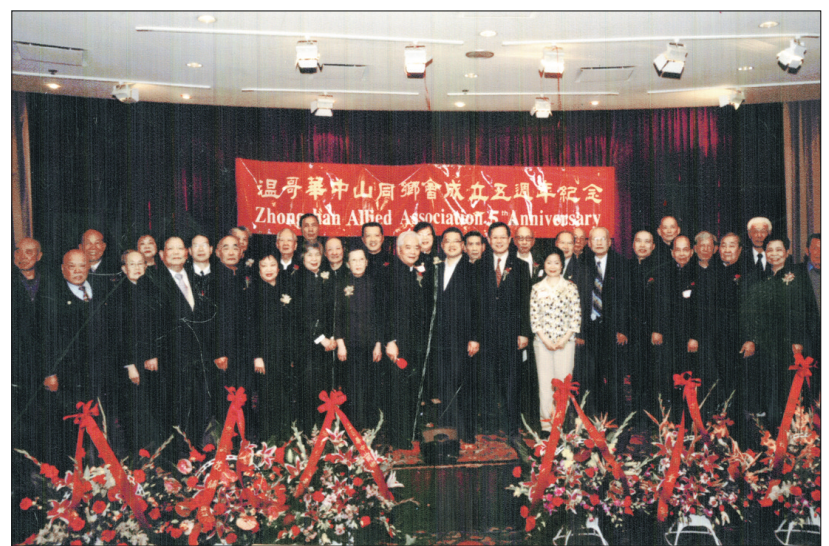
新舊職員交接 中山同鄉會日前在富大酒家慶祝成立5周年紀念暨新舊職員交接典禮，各僑團代表及社會賢達出席眾，宴會同時公布每年的獎學金計劃，勉勵會員子弟成績優異者。同場派發五周年紀念特刊及紀念品，熱鬧非常，賓主均盡興而歸。

然而，彭迪頓(Penticton)的情況則截然不同。根據數字顯示，彭迪頓的汽車盜竊案在2003年至2007年間增加62%。彭迪頓皇家騎警表示，市內大部分汽車盜竊都是由一小撮匪徒所幹，當他們被警方拘捕時，便無法再犯事，汽車盜竊案數字便會下降，否則汽車盜竊數字會繼續增加。