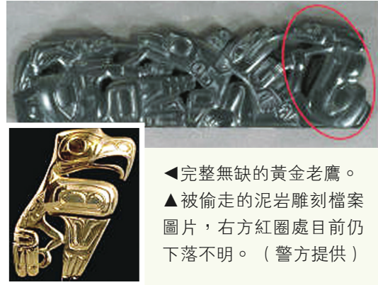
▲完整無缺的黃金老鷹。 ▲被偷走的泥岩雕刻檔案圖片，右方紅圈處目前仍下落不明。