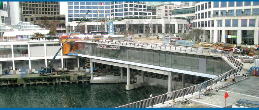
舊館將有一條無敵海景步行道通往新館。

而場館所用的玻璃，則來自錦碌市(Kamloops)一間公司，整個場館都是「卑詩省出品」。