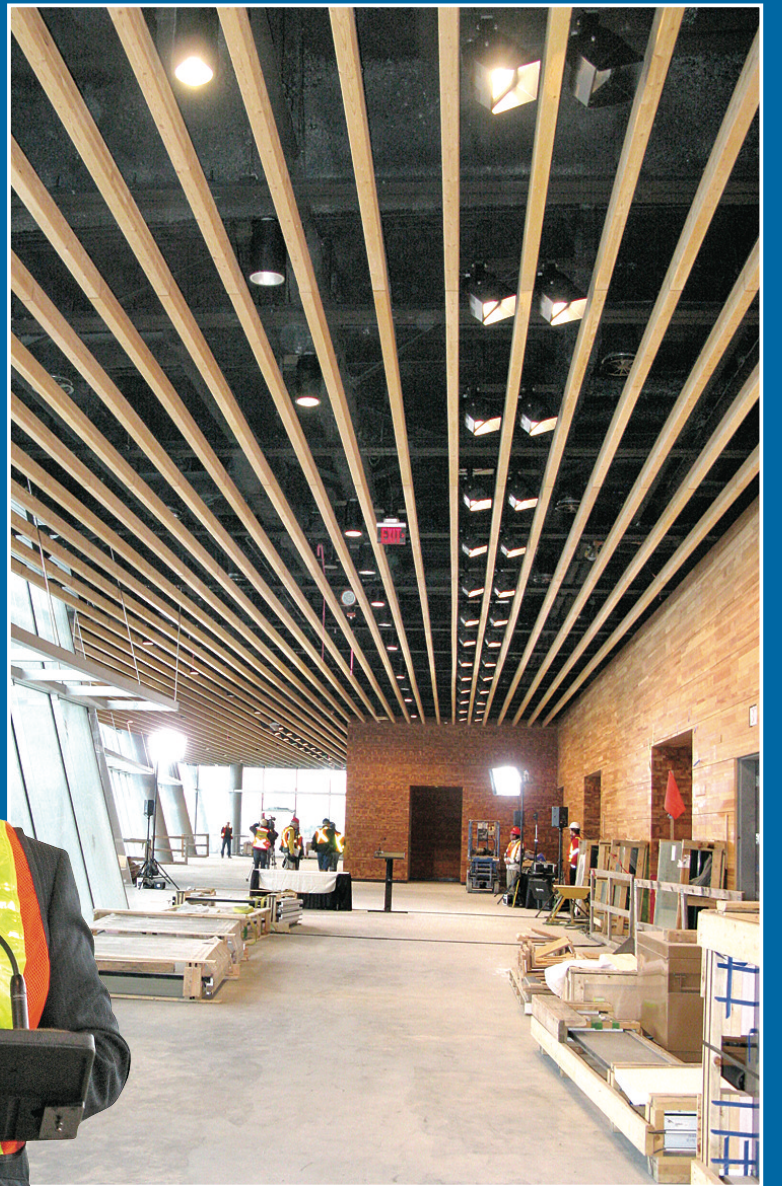
▲新館內部裝修很有藝術感。