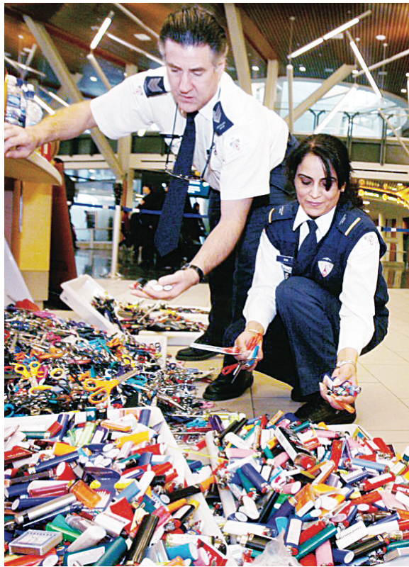
CATSA工作人員正在清點收繳的打火機和刀具等。

【明報專訊】隨著聖誕假期客流量的猛增，溫哥華國際機場每日將接待超過6萬人次的旅客。加拿大航空運輸安全局（簡稱CATSA）昨日特別發起「聰明打包」（Pack Smart）運動，提醒旅客要正確打包行李，不要隨身攜帶打火機等違禁物品，以提高更好的安檢通關效率，避免登機被延誤。