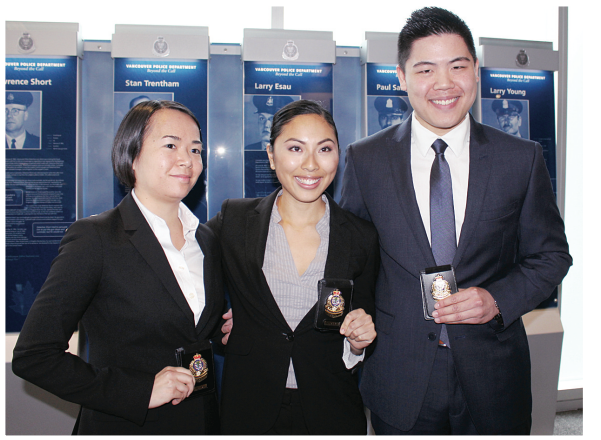
▲三名華裔學警手持警徽合影。