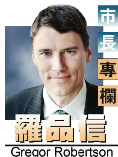
市長專欄 羅品信 Gregor Robertson

作為溫哥華市長及警務委員會主席，維護公眾安全一直是本人重視的議題。加拿大統計局上周公布的2012罪案嚴重指數(CSI)顯示，溫哥華市暴力罪案數字正在持續顯著下降，而下降速度更是全國之冠。