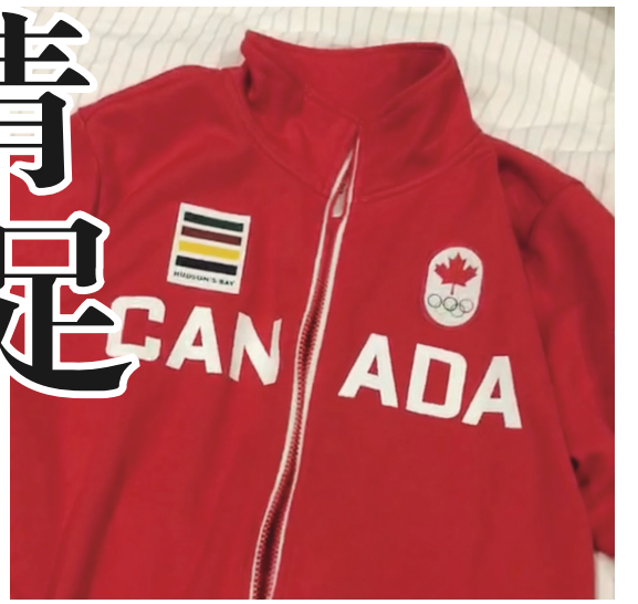
▲出征東京奧運加國隊選手的服裝。 ▲加國為出征東京奧運的選手們準備的口罩。

【明報專訊】日本疫情未見好轉，東京奧運不會讓觀眾入場觀賽與參加奧運會開幕儀式。有代表加拿大出戰東京奧運的華裔選手說，原本就不一定會參加開幕式，但家人不能親臨賽場為自己打氣，確實有點失望。目前正抓緊賽前寶貴時間，進行強化訓練，未有心思顧及有無觀眾的問題。此外，選手們已獲配發加拿大隊專用防疫口罩與隊服。