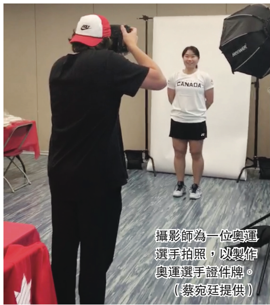
攝影師為一位奧運選手拍照，以製作奧運選手證件牌。

【明報專訊】日本疫情未見好轉，東京奧運不會讓觀眾入場觀賽與參加奧運會開幕儀式。有代表加拿大出戰東京奧運的華裔選手說，原本就不一定會參加開幕式，但家人不能親臨賽場為自己打氣，確實有點失望。目前正抓緊賽前寶貴時間，進行強化訓練，未有心思顧及有無觀眾的問題。此外，選手們已獲配發加拿大隊專用防疫口罩與隊服。