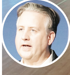
▲社區中心改成收容所。 ▲甘迺迪（圓圖）發布對溫市東端新冠疫情的防控。

【明報專訊】溫市府公布，將採取新措施，幫助市中心東端無家可歸者應對新冠疫情，並指出聯邦政府已為「毒品安全供應」（safe supply of drugs）開綠燈，應對疫情下的毒品危機；並徵用溫市中心兩間社區中心，作為疫期收容所。