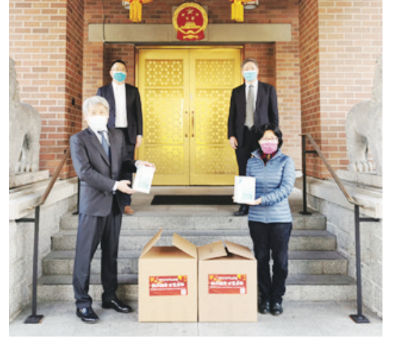
另外，捐贈給聖保羅醫院的口罩已於本月24日完成交接。