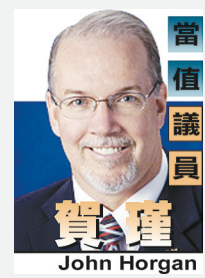
當值議員 賀謹 John Horgan

隨着夏天即將來臨，本省許多年輕人將開始尋找工作。不論是尋找夏季短期工作，或是高中、專科、大學畢業生投入職場，都將面臨本省艱難的就業市場。