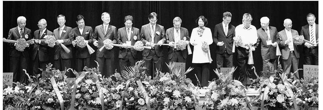
嘉賓為100周年慶典剪彩。