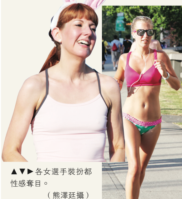
▲▲▶ 各女選手裝扮都性感奪目。