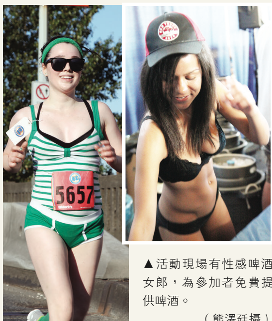
▲活動現場有性感啤酒女郎，為參加者免費提供啤酒。