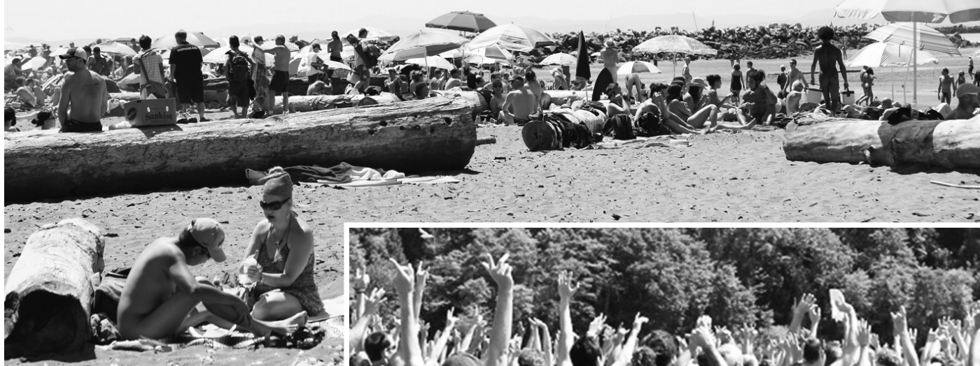
▲民眾在爛船灣盡情享受陽光與海灘。

【明報專訊】卑詩大學的爛船灣（Wreck Beach）昨日迎來第二屆裸泳大會，382名參與者拋開衣物束縛，以最原始的方式回歸大自然，暢快享受陽光和海灘，並直呼這樣的生活「很真實，很酷！」（It is real, it is cool）。