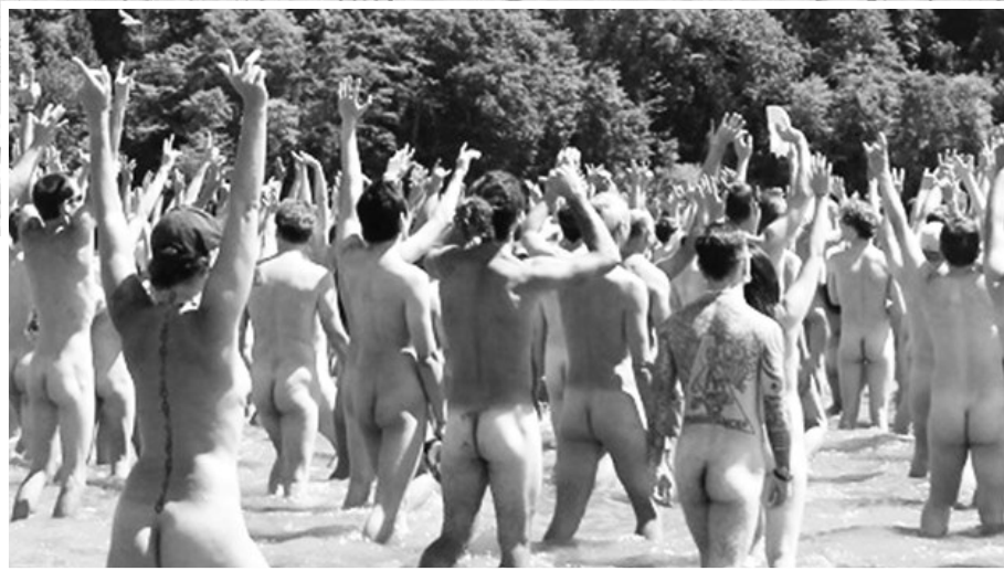
▲▼第二屆爛船灣裸泳大會吸引382人參與。

她強調，人類的城市生活到處都是鋼筋水泥的樓宇，工作時也不得不被衣物所束縛。她說：「我們需要回歸自然，需要釋出壓力，需要真實展現自己。」