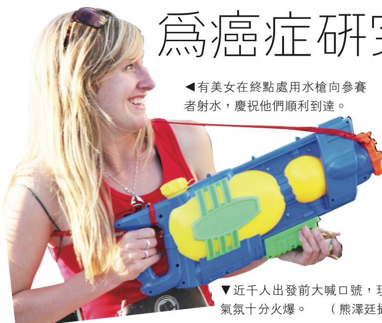
▲有美女在終點處用水槍向參賽者射水，慶祝他們順利到達。