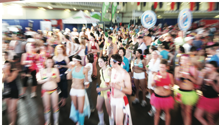
▼近千人出發前大喊口號，現場氣氛十分火爆。

【明報專訊】第5屆卑詩癌症基金會「內衣褲籌款活動」(The Underwear Affair)，昨日傍晚於溫哥華成功舉辦。近千名參加者身穿各式各樣的內衣褲，分別以跑步和步行的方式，目的是為腰部以下的癌症研究及癌症病人服務籌款，共籌得善款逾55萬。