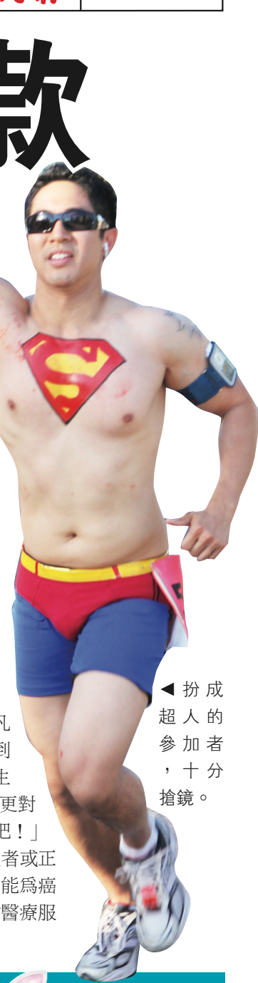
▲扮成超人的參加者，十分搶鏡。

主辦單位透露，參加者有很多本身就是癌症康復者或正在抗癌的病人，他們勇敢地穿起內衣褲籌款，希望能為癌症研究籌集更多善款，也幫助癌症病人獲得更好的醫療服務。