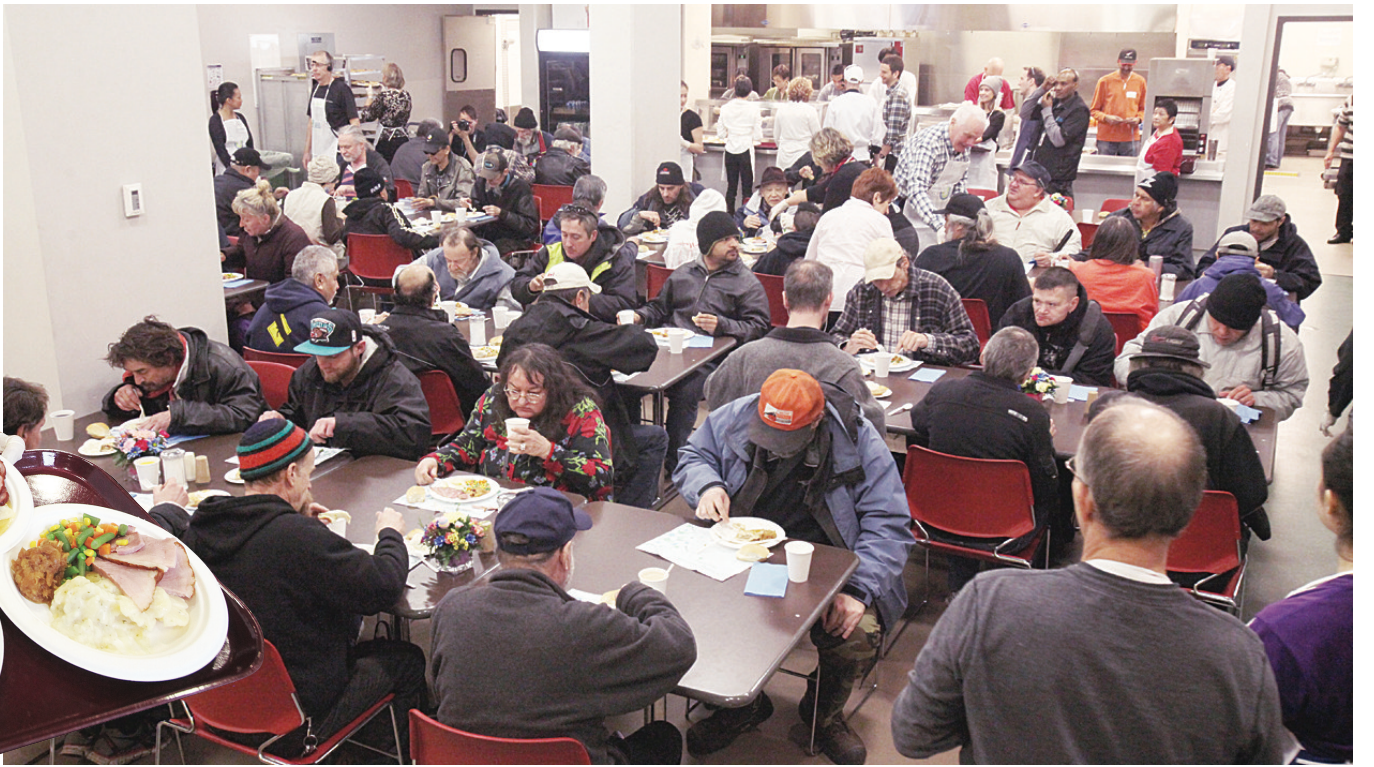
▲聯合福音使團預計昨日總共款待3000人。