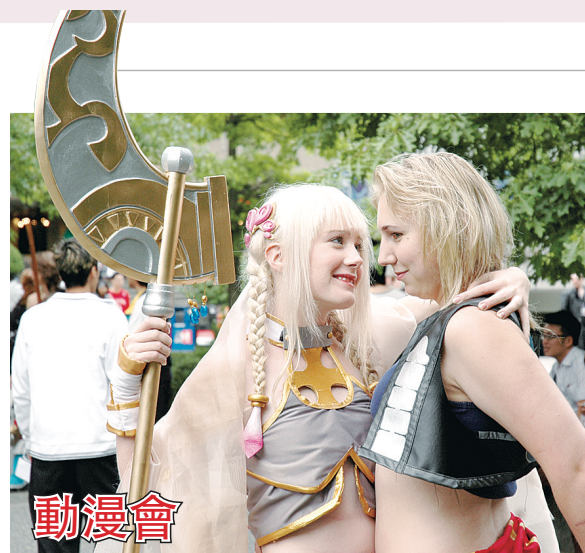
本地動漫迷年度盛會Anime Evolution從昨日起到周日，在卑詩大學學生生活中心舉行。每年這個活動均吸引逾千人參加，其中不少人會cosplay，花幾個月的時間精心製作服裝，將自己打扮成漫畫人物模樣。

隨團出訪的還有加拿大亞太總裁協會、華埠商會、華埠商業促進會、振興華埠委員會的代表。