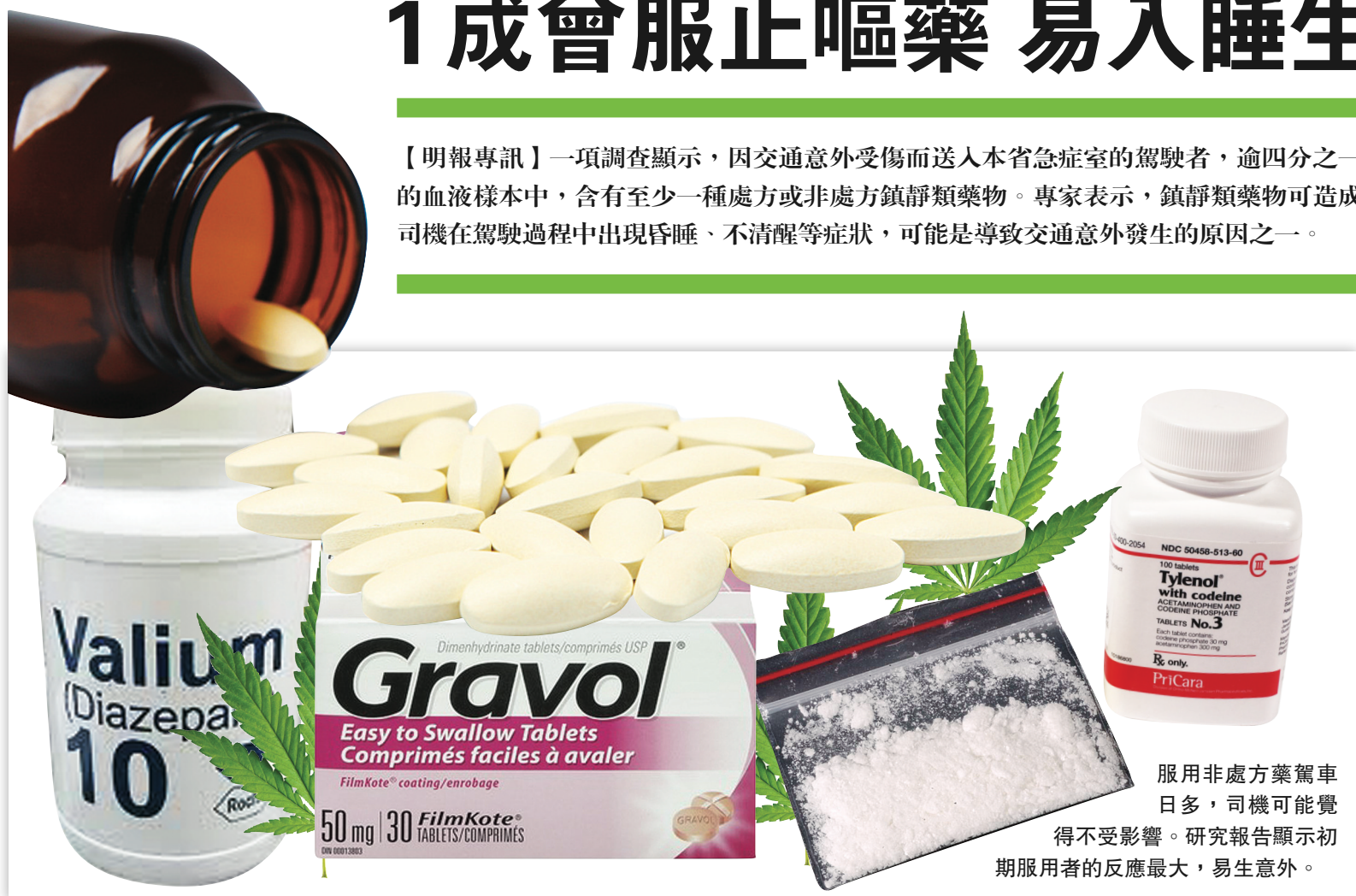
服用非處方藥駕車日多，司機可能覺得不受影響。研究報告顯示初期服用者的反應最大，易生意外。

【明報專訊】一項調查顯示，因交通意外受傷而送入本省急症室的駕駛者，逾四分之一的血液樣本中，含有至少一種處方或非處方鎮靜類藥物。專家表示，鎮靜類藥物可造成司機在駕駛過程中出現昏睡、不清醒等症狀，可能是導致交通意外發生的原因之一。