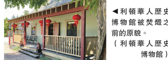
▲利頓華人歷史博物館被焚燬之前的原貌。(利頓華人歷史博物館)