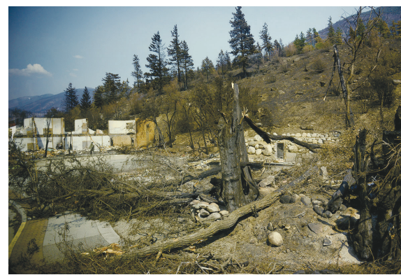
▲利頓華人歷史博物館焚燬後的近距離照片。

他稱, 他已曾與足協於加拿大的代表進行初步討論, 指若果開支較2018年為低, 本省亦有興趣。「FIFA 處於不同情況, 卑詩溫哥華亦處於不同情況, 我們現準備好去考慮那些決定和看我們能怎樣。」國際足協於2018年6月公布加拿大、美國和墨西哥成功取得2026年世界盃的聯合主辦權, 而該屆賽事的參加隊伍會由32隊增至48隊, 一共80場比賽, 美國的城市舉行60場, 包括八強後所有賽事, 而加拿大和墨西哥各舉辦10場。