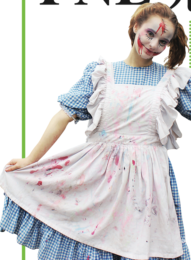
▲真人鬼娃將引導市民進入鬼屋。 ▶PNE 鬼屋要開放了, 今年聘請了99名真人演員扮鬼嚇人。

【明報專訊】太平洋國家展覽館 (PNE) 「驚嚇夜」 (Fright Nights) 鬼屋將於今晚開放, 今年總共有7間鬼屋, 市民將在真人扮的「鬼娃」引導下進入電梯間, 體驗電梯失速下降的恐怖經驗, 不時從假人殭屍陣中跳出的真人演員更會挑戰人們的膽大程度, 總共參加扮鬼的演員接近100人。