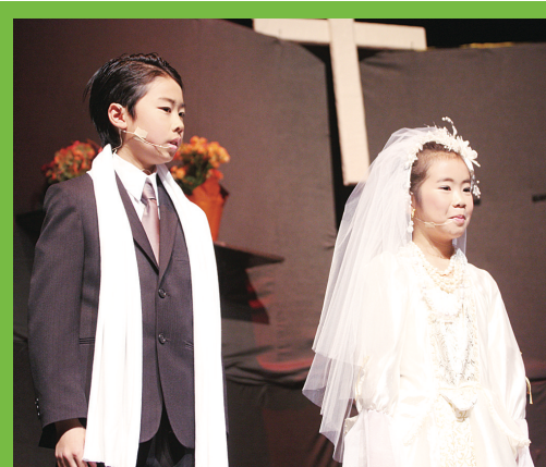
芥版《上海灘》許文強教堂搶新娘一幕。