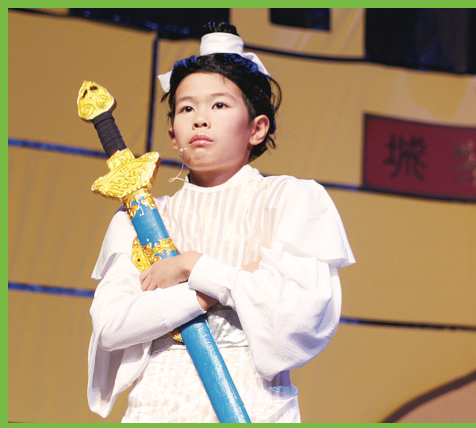
芥版西門吹雪。

加拿大青年領袖中心行政總裁何詩韻表示，芥菜種兒童劇團以往劇目均以一個完整故事貫穿全劇，但今年則作出了新突破，整個劇目以電視電影為主題，分別以不同時代背景建立6段不同故事，當中包括耳熟能詳的經典電視劇集《上海灘》及電影《Mission Impossible》及《哈利波特》等，故事中又首次加入本地及香港時事議題，例如本地教師罷工、香港地產霸權及特首梁振英住宅僭建事件等，啟發小孩子的多元思維，並透過親子合作演出，促進親子交流。