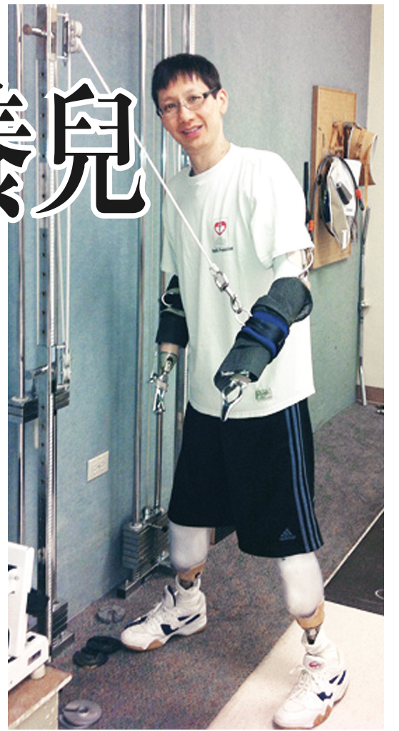
市民可以上網站 www.moseschantrust.com 查詢最新復健情況，以及捐款細節。