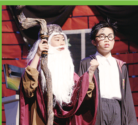
芥版哈利波特與校長 Dumbledor。

【明報專訊】加拿大青年領袖中心的芥菜種兒童劇團昨日舉行年度話劇《我們是這樣長大的?!》，兒童劇團今年作出新嘗試，將不同時代背景元素加以融合，又插入不少本地及香港時事議題，讓小孩子有更多認識及加深親子之間的交流。