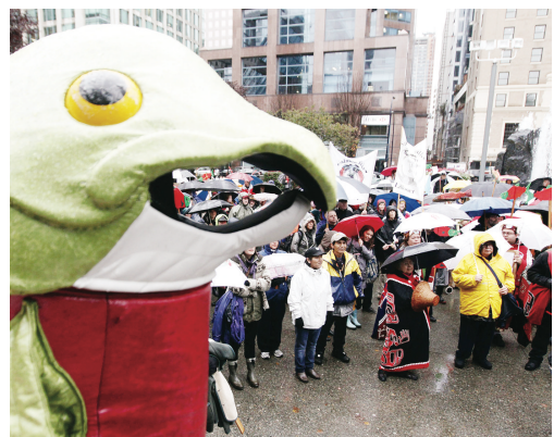
研訊昨日展開之際，身穿三文魚裝扮的女子和一些民眾在溫哥華示威。