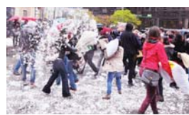
枕頭大戰打致遍地「開花」。

【明報專訊】溫哥華市中心美術館門外昨日下午3時發生「枕頭大戰」，約有50至60名市民參加，吸引大批市民圍觀。參加者興高采烈揮舞手中不同款式枕頭，在雨上進行大混戰，部分單打獨鬥，部分聯群結黨「襲擊」其他人，就算被枕頭痛擊，仍然笑容滿面。