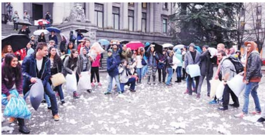
參加者排開陣勢作終極一戰。