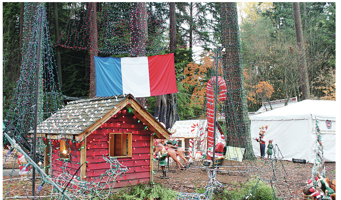
燈飾群中掛上了法國國旗，向遭遇恐襲的法國人民送上祝福。

Kirby-Yung)表示，全新搭建的有蓋火車站今年正式亮相，新車站比以前寬敞，可以容納更多市民，不用再冒雨排隊等候。