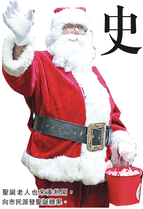
聖誕老人也來湊熱鬧，向市民派發聖誕糖果。