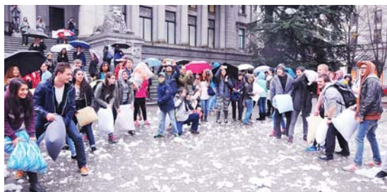
參加者排開陣勢作終極一戰。