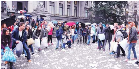
參加者排開陣勢作終極一戰。