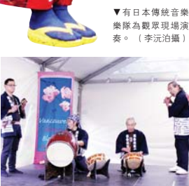
有日本傳統音樂樂隊為觀眾現場演奏。

有參加者更把枕頭打致「開花」，棉絮或羽毛四散落在參加者頭上和地面。他們最後不約而同排開陣勢進行終極一戰，以結束這場為時約30分鐘的枕頭大戰，不少華裔亦加入戰團。