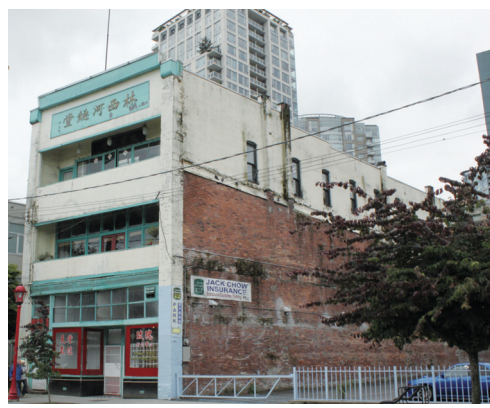
▲林西河總堂建於 1903 年。(資料圖片)

【明報專訊】溫哥華市議會昨日通過撥給林西河總堂最多 10 萬元修葺大廈，這筆款項需用作修復這幢華埠最具歷史堂所大樓的正面及背面兩外牆。