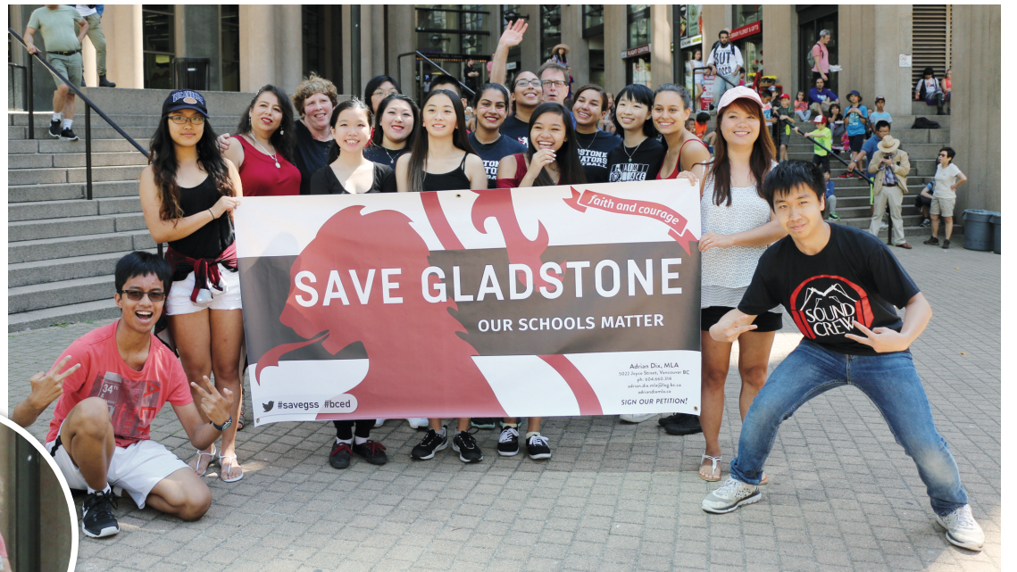
▲約 20 名中學生昨日在溫市中心拉起橫幅反對殺校。