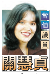
省長金寶爾近日不提「希望」兩個字了。競選時，每當發表談話，他總不忘把「希望的新紀元」掛在口頭。理由很簡單，「希望」現已置於自由黨政府議程最後一項，特別是我們下一代的希望，由於政府大舉削減服務而變得渺茫。

【明報專訊】倫弗魯社區中心(Central Community Centre)肖像繪畫活動，你買下它，你畫出它，你賣出它。這是一項由社區中心主辦的繪畫活動，旨在提高參與者的繪畫技巧，並通過拍賣作品來籌集資金。活動將於二月十七日開始，逢星期一至五下午五時至九時半，星期六上午十時至下午四時。收費如下：半小時作品，收費三十元；一小時作品，收費五十元。市民查詢請電六零四·二九一·零八八。