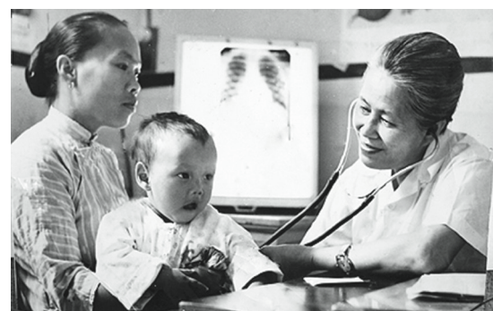
張肖白行醫照片。