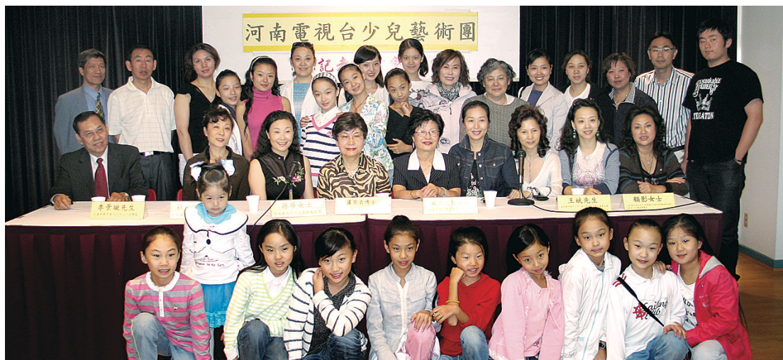
大溫哥華中華文化中心歡迎中國河南電視台少兒藝術團到訪。