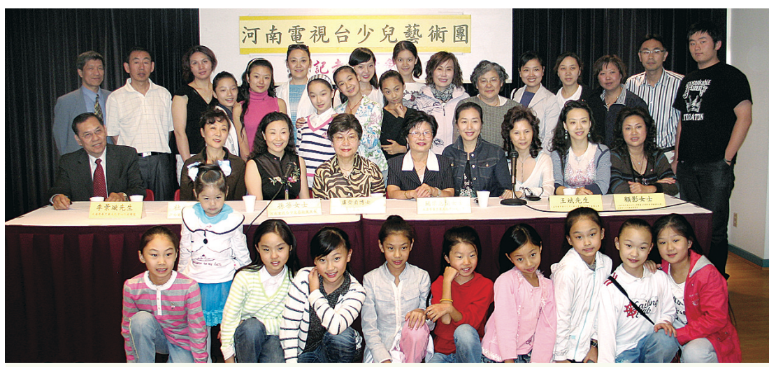
大溫哥華中華文化中心歡迎中國河南電視台少兒藝術團到訪。