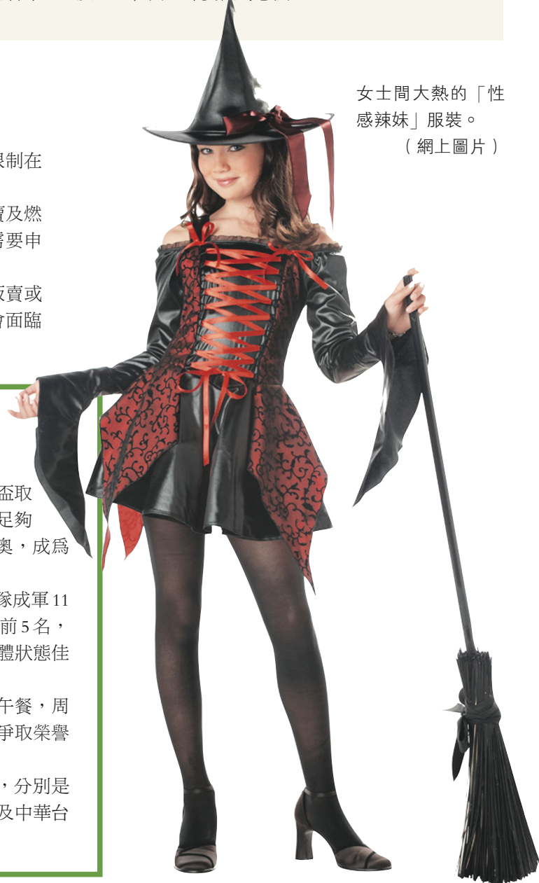
女士間大熱的「性感辣妹」服裝。

亞太盃這次總共有6支隊伍參賽，分別是日本、南韓、澳洲、中國、紐西蘭及中華台北即台灣。