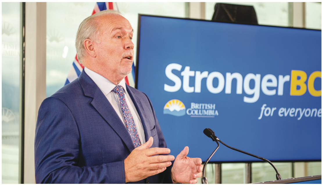
賀謹希望新中心能加快本省潔淨能源技術的發展。（卑詩省府）

【明報專訊】卑詩省府昨宣布，將與聯邦政府和加拿大規殼（Shell Canada）燃油公司合作，合共提供超過1億元的資金，在省內設立一個新的創新及潔淨能源中心，希望藉此減低本省經濟系統的碳排放，以及擴展潔淨能源的規模。