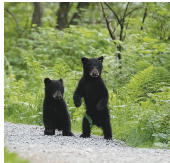
兩隻與孤兒幼崽事件無關的幼熊。

野生動物關愛組織成員說，這個季節的熊崽是非常脆弱的，牠們體型非常小，比貓稍大一點。如果沒有保育官員服務處保護，未斷奶的熊崽是無法生存的。