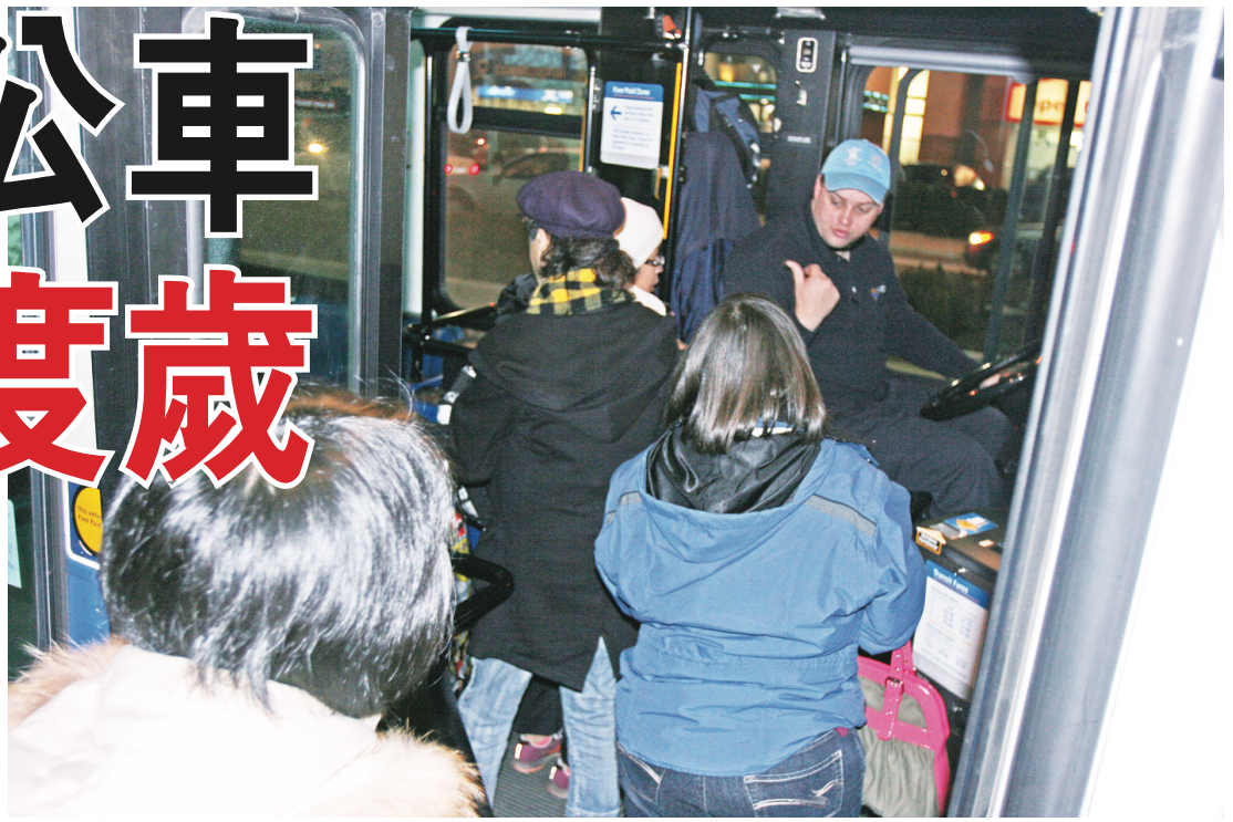
▲巴士司機揮手叫乘客上車，不用付錢。

餐廳是晚上9時30分打烊，但他們昨晚在5時出發，有信心能夠在餐廳關門前趕到餐廳。另一方面，5時開始後，巴士司機也如期免費讓乘客乘坐。但並不是所有乘客知道免費服務，部分人欲付費時，被司機提醒才知道可搭免費車。