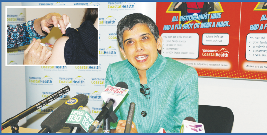
◀大圖：達瓦爾呼籲市民盡早接種流感疫苗。 小圖：護士正在為市民注射流感疫苗。

【明報專訊】卑詩疾控中心指出，今年流感季節比往年提早來臨，而且病毒的侵略性亦比去年更強。溫哥華沿岸衛生局呼籲市民盡快接種流感疫苗，尤其是耆老、5歲以下兒童以及長期病患等易感染人群。