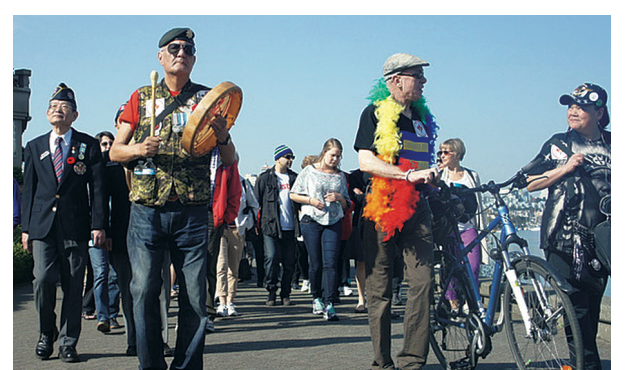
昨日近百名市民參與權利與自由遊行。

Prices are subject to change and to applicable taxes. Pictures, drawings and digital renderings are for illustrative purposes only and should not be relied upon. E&OE. Sales and Marketing by Intracorp Realty Ltd. Intracorp C35 Limited Partnership.