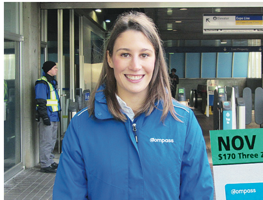
▲莫蘭表示，明年1月起將不再印製紙版月票 (右圖)。

運聯表示，現時每個車站內都有一部分入閘機使用開門系統，乘客如未有拍卡，將不能通過開門