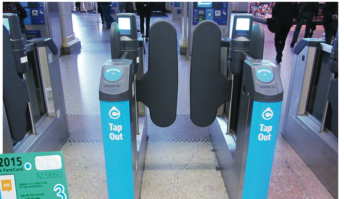
▲現時每個車站有一部分入閘機使用開門系統，乘客如未拍卡，閘門維持關閉。

而至於傳統的紙版單程優惠車票 (faresaver)，運聯則表示，現階段暫不會停止發售這些車票