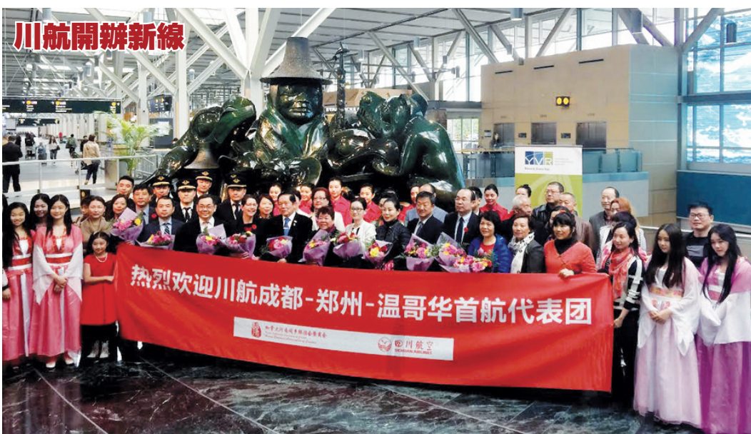
溫哥華國際機場 (YVR) 本月 11 日迎來首個從中國鄭州新鄭國際機場 (CGO) 起飛的 3U8501 航班, 這個由四川航空開辦的航線每周兩班, 抵達及離開溫哥華國際機場的時間分別是上午 8 時 35 分和上午 10 時 25 分。聯邦參議員胡子修及列治文市長區澤光等參加首航的歡迎儀式。