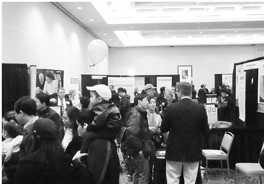
私立學校博覽會吸引過千父母前來查詢。

瑪格提到，今年參展的學校數目與去年差不多，但登記和實際到場的家長人數就大幅增長，她認為現象應與卑詩公共教育最近陷入削