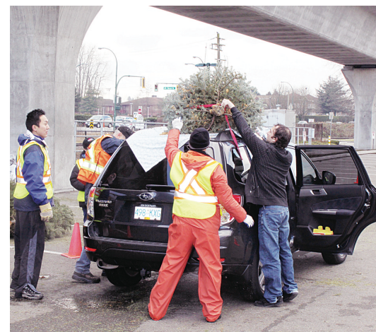
市民帶來廢棄的聖誕樹，並為活動捐款。

市民可在今日上午 10 時到下午 4 時將廢棄聖誕樹帶到以下 4 個地點回收：East Boulevard 夾 41 街 (41st Ave.) 以北的 Kerrisdale 溜冰場停車場，康禾爾路 (Cornwall Ave.) 和阿標特斯街 (Arbutus St.) 之間的 Kitsilano Beach 停車場，沙灘路 (Beach Ave.) 夾布勞頓街 (Broughton St.) 的 Sunset Beach 上層停車場，及位於東 12 街 (East 12th Ave.) 2727 號的 Rona 商場停車場