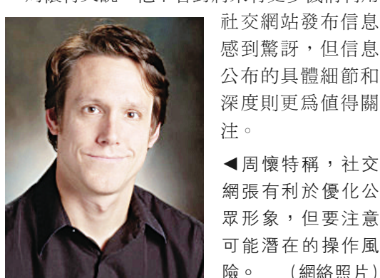
周懷特稱，社交網張有利於優化公眾形象，但要注意可能潛在的操作風險。(網絡照片)