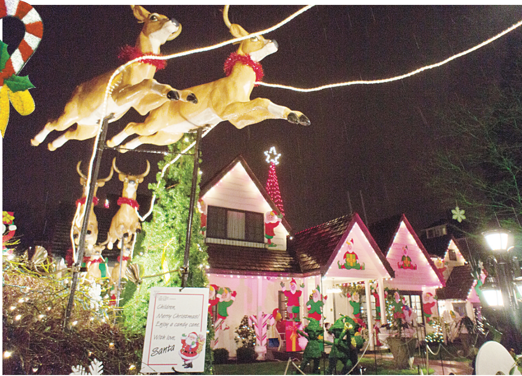
溫哥華 Laurier 路 1412 號的民居燈飾。

聖誕期間，許多市民會絞盡腦汁，將自己的房屋及花園裝上大量聖誕燈飾。如溫東 Trinity 街上的多間民居，便會合力將整條街打造成不輸大型燈會的美景。其餘像 Laurier 路 1412 號、Mathews 路 1690 號、東 1 街 2504 號、東 39